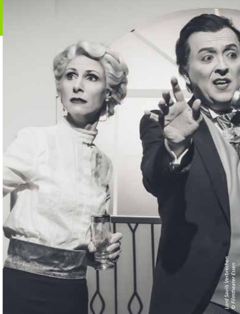
Lord Savils Verbrechen

Liebe Kulturfreundinnen, liebe Kulturfreunde,