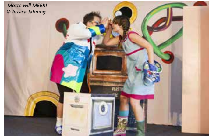
Motte will MEER!

nach Carlo Collodi Die Geschichte rund um die hölzerne Puppe mit der verräterisch wachsenden Lügennase begeistert Kinder schon seit weit über hundert Jahren bis heute. Kein Wunder, geht es dabei doch um das Leben selbst und um die Frage, was es braucht, um ein Mensch zu sein. Burghofbühne Dinslaken Samstag, 28. Mai 2022 (VVK ab 7. Mai)