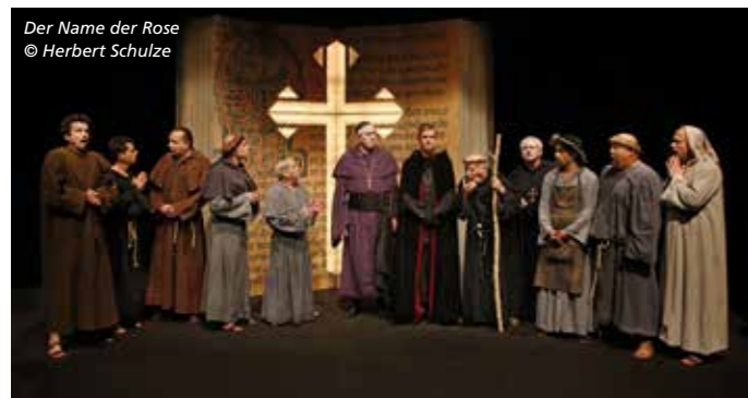
Der Name der Rose

Dienstag, 26. April 2022 (VVK ab 5. April)