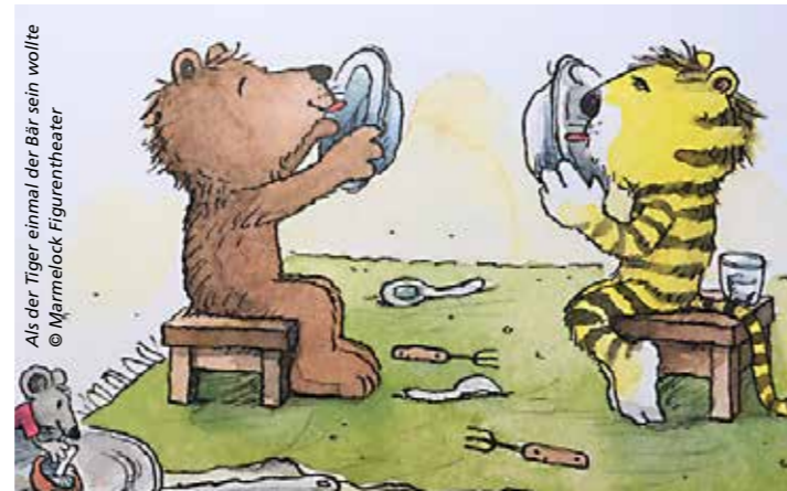
Als der Tiger einmal der Bär sein wollte © Marmelock Figurentheater

Vier tierische Freunde, Maus, Frosch, Spatz und Schnecke. Jedes Tier muss eine Mutprobe bestehen, die es sich noch nie getraut hat. Doch bringt jeder genug Mut auf, seine Prüfung zu bestehen? Die Komplizen Donnerstag, 10. März 2022 (VVK ab 17. Februar)